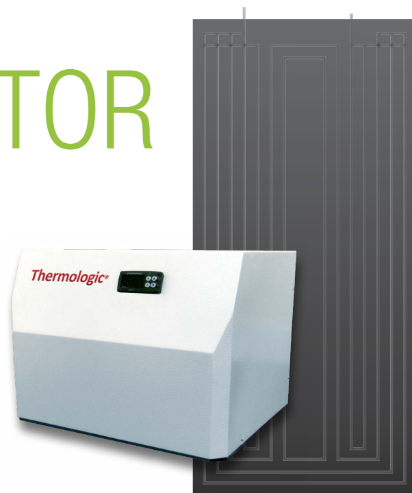
Thermologic boks med alupanel.